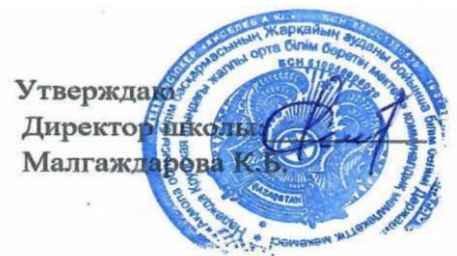
График СОР и СОЧ за 4 четверть на 2022-2023 учебный год