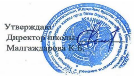
График СОР и СОЧ за 4 четверть на 2022-2023 учебный год