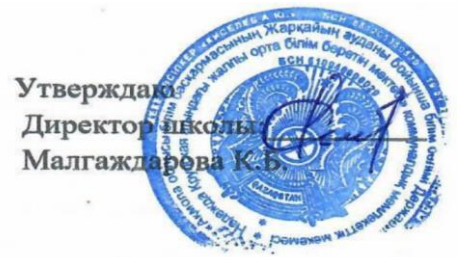
График СОР и СОЧ за 1 четверть на 2022-2023 учебный год