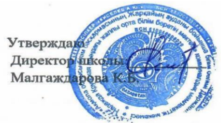
График СОР и СОЧ за 2 четверть на 2022-2023 учебный год