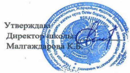
График СОР и СОЧ за 1 четверть на 2022-2023 учебный год