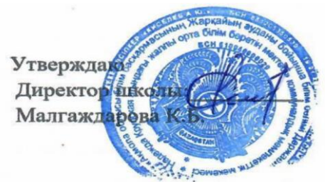
График СОР и СОЧ за 4 четверть Начальная школа 2022-2023 учебный год