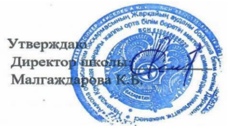
График СОР и СОЧ за 1 четверть Начальная школа 2022 – 2023 учебный год