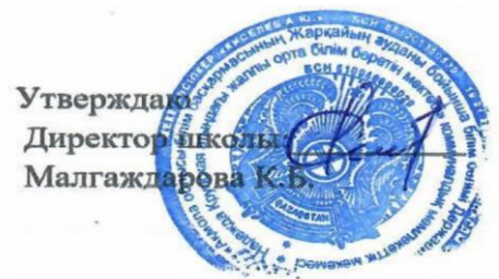
График СОР и СОЧ за 2 четверть на 2022-2023 учебный год