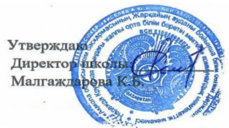
График СОР и СОЧ за 3 четверть на 2022-2023 учебный год